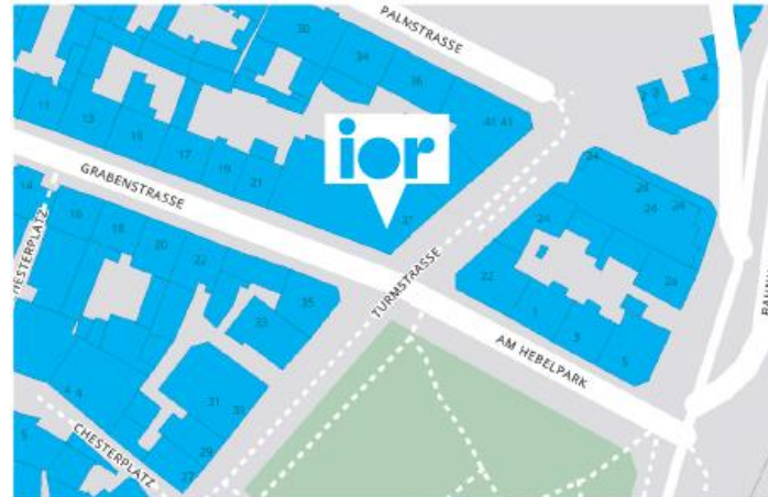
iOR Sprachakademie Lörrach